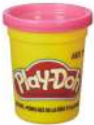
MASA PLAY DOH