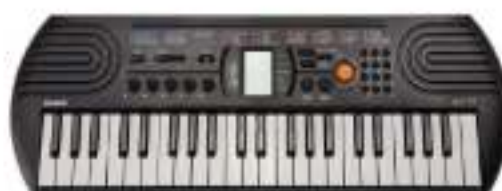
Teclado 44 teclado