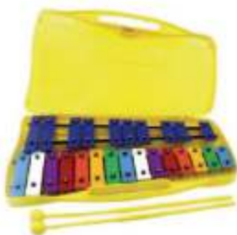
Metalófono 25 Placas