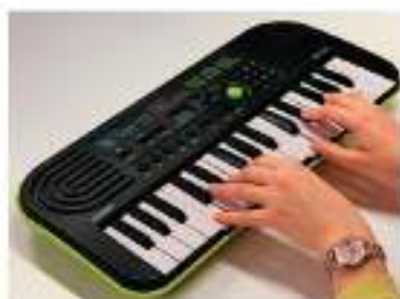
Teclado 32 teclado

Se solicita dentro de lo posible que los estudiantes puedan contar con su propio instrumento musical, aquí van las siguientes opciones: